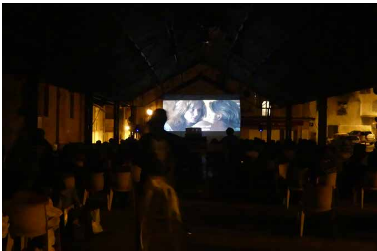
THELMA ET LOUISE de Ridley Scott