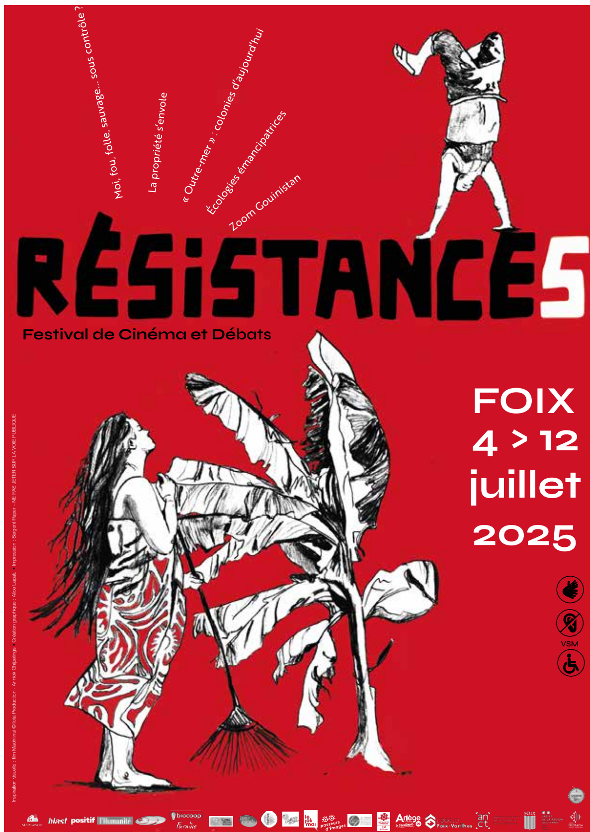
Affiche réalisée par Alice Lapalu

L'idée que le masculin représenterait l'universel est vivement critiquée : on sait que les usages langagiers participent aux représentations sociales. Nous pensons que l'usage d'un langage inclusif est une menace pour la domination masculine, pas pour la langue française. Nous l'utilisons donc pour rédiger le présent dossier : quand le terme se réfère aux hommes et aux femmes nous mettons des points médians : « opprimé-es » et nous utilisons des mots comme le pronom « iels » contraction de « ils » et « elles », ou comme « ceuxx », contraction de « celles » et « ceux ».