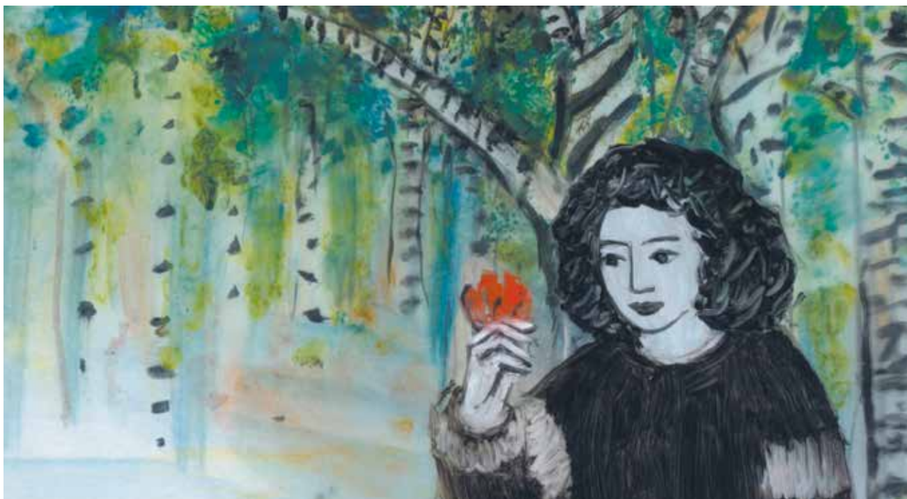
LA TRAVERSÉE , de Florence Mialhe

Dans le contexte terrible du génocide à Gaza, nous avons décidé de ne pas rester sourd-es aux récits des gazaouis qui peinent à parvenir jusqu'à nous. Nous avons donc projeté en séance spéciale, le programme de deux heures et vingt-deux courts-métrages réalisés depuis Gaza par ses habitant-es From Ground Zero . Le public de Résistances a été au rendez-vous.