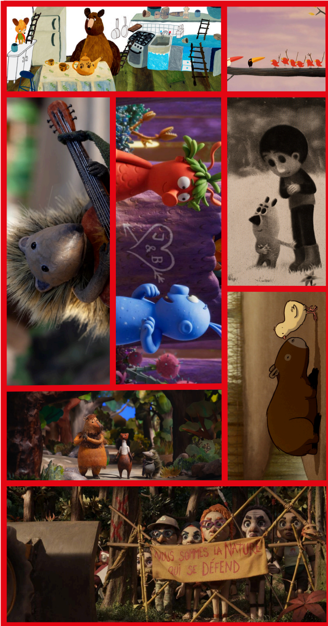
Les films du préau - Les tourouges et les toubleus © KMBO - Une guitare à la mer © Haut et court - Dounia et la princesse d'Alep © Gebeka - Les ours gloutons © Haut et court - Sauvages