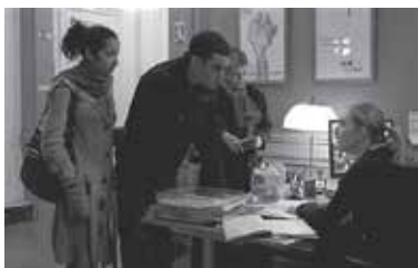
Fiction, (2008) En présence de la réalisatrice : Claire Simon