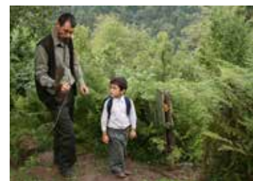
Fiction (2010) de Semih Kaplanoğlu

Les abeilles se faisant de plus en plus rares, Yakup est obligé de partir travailler de plus en plus loin dans la forêt. Mais il tarde à revenir, et le monde se retrouve soudain plein de son absence