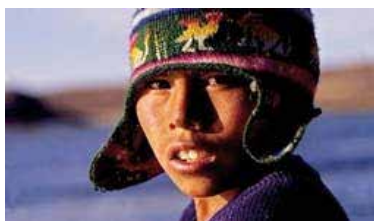
Documentaire (2010) de Carmen Castillo

Chili, cordillère des Andes. Ici se trouve la plus grande réserve d'or au monde, objet d'un conflit sans merci qui oppose la plus grande multinationale d'exploitation d'or, la Barrick Gold, aux Indiens de la vallée. L'extraction nécessitant le recours à l'eau en grandes quantités et le rejet de nombreuses matières toxiques (cyanure, mercure, etc.), les agriculteurs craignent de voir leur principale ressource polluée, leur village détruit par le tarissement de la source. Du coup, le spectre de l'exil, qu'ont connu de nombreux villages alentour, se profile.