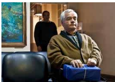
Fiction (2010) En présence du réalisateur : Nicolás Lasnibat

Armando, ancien syndicaliste portuaire, a perdu sa jambe gauche après avoir été torturé lors du coup d'État du général Pinochet. Il vit avec sa nièce près du port de Valparaíso. Reclus et triste, il doit faire face au quotidien à l'imposant voilier La Esmeralda, qui sert de base à toutes les atrocités du régime. Mais aujourd'hui, Armando amorce un nouveau départ. Sa première jambe orthopédique l'attend et avec elle peut-être l'espoir de vivre enfin ses désirs les plus enfouis.