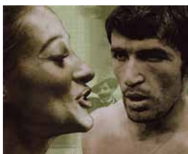
Fiction (1967) de Aleksandar Petrović

L'amour, la liberté, la fierté, dans des villages tziganes de Yougoslavie. En 1967, Aleksandar Petrović réalise le premier film dans la langue romani tourné avec des acteurs tziganes. De verve réaliste, cette fiction dépeint des personnages en but à mille difficultés mais pourtant des « Tziganes heureux ». Ces héros toujours en mouvement nous entraînent dans un tourbillon de musique et de couleurs, dans une ambiance Nouvelle Vague. Grand prix spécial du jury au festival de Cannes en 1967.