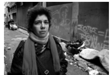
Documentaire (2013) En présence du réalisateur : Yannis Youlountas

Un grand bol d'air frais, d'enthousiasme et d'utopies en marche, venu de la mer Égée.