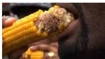
Documentaire (2010) de Anne Guicherd

Aujourd'hui, près d'une personne sur sept souffre de la faim, et, avec l'augmentation de la population il faudra nourrir trois milliards d'individus supplémentaires d'ici 2050. Or, les ressources naturelles permettant à l'homme de se nourrir sont en voie d'épuisement et sont de plus en plus mal réparties. Nourrir le monde est un défi aux enjeux multiples, environnemental, social, politique. Dans cette perspective, quel peut-être l'apport de la recherche scientifique ? Quels rapports entretiennent les pays du Nord avec ceux du Sud ? Comment mettre en place une agriculture alliant respect des sols et productivité ?