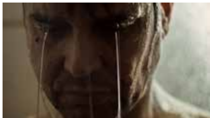
Fiction (2012) de Fernando Guzzoni

« Carne de Perro » nous plonge deux semaines durant dans l'univers chaotique d'Alejandro. Un homme fragile jusqu'à la rupture, imprévisible, écrasé par un passé opaque, égaré entre ses fantasmes et sa véritable identité. Un homme au bord de l'abîme dont le regard sur le réel s'est troublé. « Carne de Perro » est l'histoire dans le Chili d'aujourd'hui d'un ancien tortionnaire qui tente de se réinventer pour retrouver un sens à sa vie.