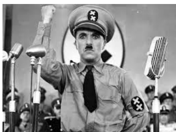
Fiction (1940) de Charlie Chaplin

Lors de la Première Guerre mondiale, dans un pays imaginaire nommé la Tomanie et ressemblant beaucoup à l'Allemagne des années 30, un soldat maladroit sauve la vie d'un pilote de chasse. Un chef d'œuvre du burlesque dans lequel Chaplin, parodie Hitler et critique le régime Fasciste.