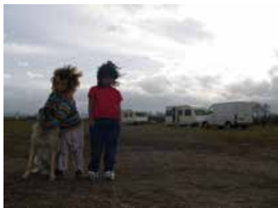
Documentaire (2005) de Sébastien Balanger

Une femme secoue les branches d'un cerisier le sourire aux lèvres. Elle fourre des poignées de cerises dans son sac en plastique. Le réalisateur l'interroge « Qu'est-ce que tu ferais si le paysan te voyait ? » Elle lui répond simplement : « Je lui dirais que j'avais envie de quelques cerises. »