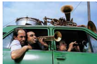
Documentaire (2006) de Jasmine Dellal

Le film retrace le portrait de ces musiciens, sur scène et à la ville, dans leurs familles et sur la route. Un voyage riche et initiatique, au sens propre et figuré.