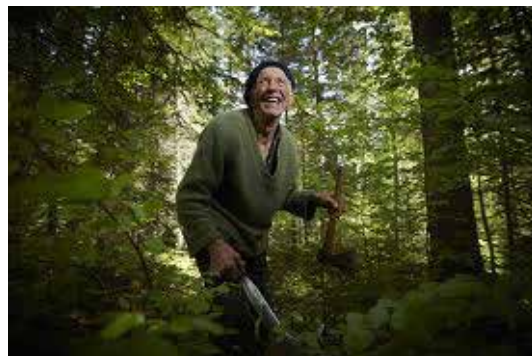
Le Cueilleur d'arbres (2009)