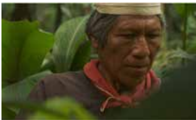
Documentaire (2012) de Jacque Sarasin

Dans un monde à sens unique, où les pays du nord exportent leur modèle économique et politique dans le monde entier, il existe un pays d'Amérique latine qui s'est engagé dans une réforme profonde de ces modèles et invente une nouvelle gouvernance, pragmatique et humaniste: l'Équateur. Rafael Correa, économiste réputé en est devenu le Président en 2006.