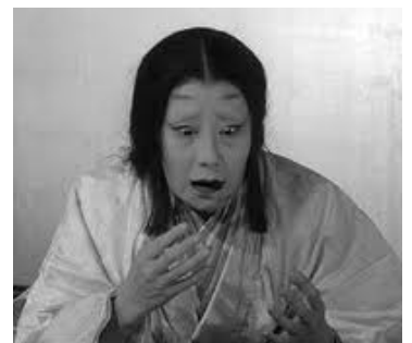
Fiction (1957) de Akira Kurosawa

Mise dans la confiance, la femme de Washizu va influencer son mari pour que la prophétie se réalise seulement à l'avantage de celui-ci.