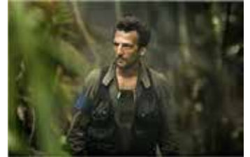
Fiction (2011) de Mathieu Kassovitz