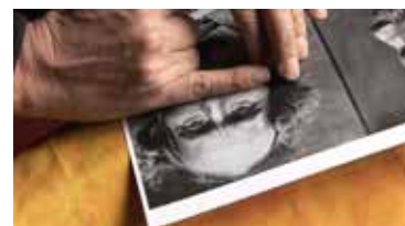
Documentaire (2012) En présence du réalisateur : Raphaël Pillosio

En 1912, dans le cadre d'une loi visant à contrôler le commerce ambulant, la République Française imposait le port d'un Carnet Anthropométrique d'identité à une catégorie administrative créée à l'occasion, les «Nomades». A travers la restitution aux familles concernées de photographies contenues dans les Carnets Anthropométriques, le film dresse un portrait de l'intérieur, de l'hétérogénéité des «Gens du Voyage». En contre-point, des historiens réfléchissent aux conséquences de cette loi. Ce film propose de réfléchir à la situation passée et actuelle des «Gens du Voyage».