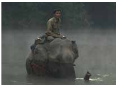
Documentaire (2010) En présence du réalisateur : de Jean-Philippe Martin

Le Laos possède une des dernières forêts primaires d'Asie. Depuis quelques années, des milliers d'hectares de cette forêt ancestrale sont abattus pour être remplacés par une culture industrielle d'hévéa, l'arbre à caoutchouc. Trois initiatives locales soutenues par des ONG sensibilisent les jeunes laotiens à la richesse de leur patrimoine environnemental et au danger de cette déforestation aux conséquences irréremédiables pour la biodiversité. Une incitation aussi à promouvoir des emplois locaux et à générer un développement durable.