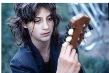
Fiction (2002) de Tony Gatlif

Max, un garçon de dix ans, se découvre une passion pour le jazz manouche. En vacances chez sa grand-mère, il se rend dans le quartier des gitans pour faire l'acquisition d'une guitare. Le temps d'un été, Max fera, auprès de Miraldo, un musicien virtuose, l'apprentissage de la musique et de la culture manouche. Par ailleurs, il connaîtra ses premiers émois amoureux aux côtés de l'énigmatique Swing, une fille de son âge.