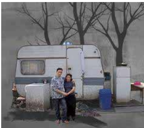
Moulin-Galant, la question Rom (2011)

Gitans, manouches, tziganes, bohémiens, gens du voyage... Autant d'appellations que de populations, nomades ou sédentaires, réunies sous le nom de « Roms ».