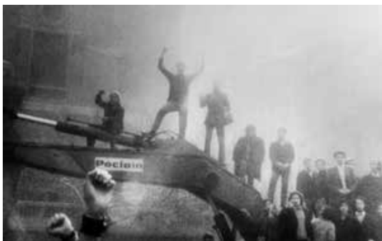
La Bataille du Chili (1976)

11 septembre 1973 : coup d'Etat contre le gouvernement du président Salvador Allende. 40 ans plus tard, Résistances met à l'honneur le cinéma chilien. Laminé par la dictature, il renaît aujourd'hui avec une belle vitalité. Tandis que certains cinéastes traquent, en fictions et en documentaires, la part douloureuse de l'Histoire, une nouvelle génération de réalisateurs choisit de nouvelles formes d'expression pour nous parler de son pays et poser les jalons de ce que sera le cinéma de demain.