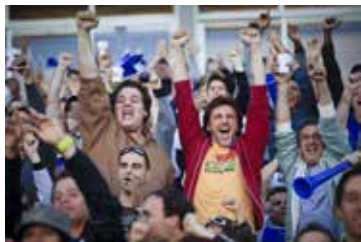
Fiction (2011) de Ken Scott

Tout juste au moment où David Wosniak apprend que Valérie est enceinte, cet éternel adolescent de 42 ans découvre qu'il est le géniteur de 533 enfants. Dans la foulée, il apprend aussi que ses enfants se sont regroupés dans un recours collectif qui veut faire invalider la clause d'anonymat qu'il a signée lors de ses dons de sperme. Catastrophé, David refuse de se révéler.