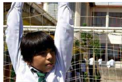
Fiction (2009) Alejandro Fernández Almendras

Une longue journée à la fin de l'été, quatre membres d'une famille paysanne du sud du Chili ont du mal à s'adapter au monde qui les entoure. On suit chacun dans son emploi du temps dans un monde où un jeu vidéo ou une nouvelle robe peuvent être aussi précieux qu'un litre de lait ou un verre de vin. Un monde nouveau, globalisé, où les frontières entre tradition et modernité s'effacent et où les valeurs se transforment rapidement.