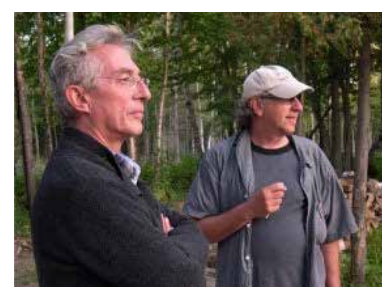
Documentaire (1999) de Richard Desjardins, Robert Monderie

La forêt a toujours été une source de matière première considérée tellement riche qu'elle en est quasi-inépuisable. Alors que le discours officiel assure que le patrimoine forestier demeurera, malgré l'industrialisation, la population ignore les effets néfastes de la coupe à blanc sur de grandes étendues du territoire québécois. Richard Desjardins donne sa vision de la situation sur l'exploitation erratique et abusive de la forêt boréale québécoise et questionne la responsabilité citoyenne face à la destruction de l'environnement.