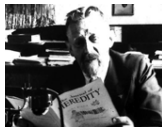
Documentaire (2012) En présence du réalisateur : Guillaume Dreyfus

« Hygiène raciale » fut le nom donné à l'eugénisme, en Allemagne, dans les années 1930. Ce film raconte l'histoire de cette idéologie, en se concentrant sur l'eugénisme négatif : son but était d'empêcher la propagation de certaines maladies, que la science de l'époque estimait alors héréditaires. L'eugénisme fut l'un des piliers idéologiques du nazisme. Toutefois, cette idéologie n'a pas seulement été appliquée dans l'Allemagne nazie, mais aussi, à une moindre échelle, dans d'autres pays occidentaux, comme la Suède et les Etats-Unis.