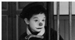
de Pierre Étaix 1965 / français / 97'

Un riche petit garçon s'ennuie, seul et entouré de ses domestiques, jusqu'au jour où passe un cirque. Il reconnaît dans l'écuyère la jeune fille qu'il aime en secret. Hommage au cinéma muet et burlesque, ce film référence est une plongée dans le monde de l'absurde.