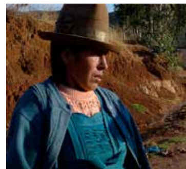
Documentaire (2012) de Mathilde Damoiseil

Entre 1995 et 2000, plus de 330 000 femmes et près de 30 000 hommes ont été stérilisés de force par le gouvernement d'Alberto Fujimori, soutenu par les instances internationales. Quechuas pauvres et analphabètes, c'est parce qu'ils représentaient aux yeux des dirigeants péruviens et des décideurs du monde occidental la nouvelle grande menace pour l'avenir de l'humanité... Cette tragédie s'est réalisée avec la complicité de la Banque mondiale, des Nations unies et de l'USAID (l'agence américaine d'aide au développement) qui ont érigé la stérilisation choisie ou forcée comme instrument de lutte contre la surpopulation, fût-ce au prix de milliers d'existences brisées.