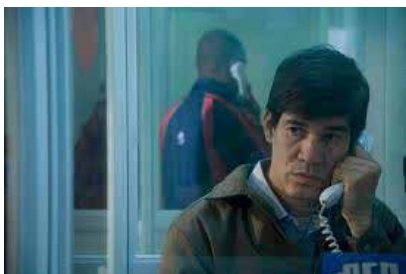
Fiction (2011) de Oscar Godoy

Julio, professeur d'histoire péruvien, à la recherche d'un emploi au Chili, souffre des discriminations racistes. Oscar Godoy dresse le portrait sensible d'un homme contraint à quitter sa famille et son identité, sous la pression économique et qui ne rencontre que précarité et solitude. Cette odyssee décrit le quotidien tout en finesse d'une figure souvent réprouvée au fil des siècles et ce jusqu'à nos jours : le migrant.