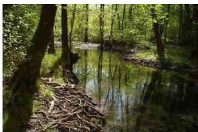
Documentaire (2012) En présence du réalisateur : Jean-Philippe Macchioni