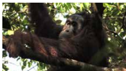
Documentaire (2009) de Patrick Rouxel