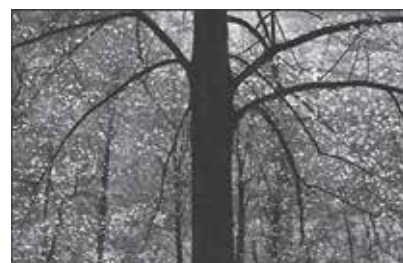
de David Maury

«Des photographies noir et blanc, juste des photographies d'arbres. Rappeler le mot célèbre de Frank Stella : ce que vous voyez est ce que vous voyez. Des arbres du parc thermal d'Ussat-lesbains en Ariège qui forment une grande famille, une «parentèle». Images, issues d'une «petite pratique» de la photographie. Une sorte de naturel qui s'inscrit en faux de la nécessité de la signification et du sens, de la dimension sociologique, de la théorie et de la notion de progrès de l'art juste un exercice au fil des saisons, une discipline. »