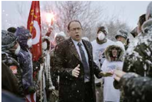
L'Exercice de l'Etat (2011)

Toute forme d'organisation collective fait naître des enjeux de pouvoir. Dans une société mondialisée, de plus en plus complexe, dans laquelle le développement des échanges est sans précédent (biens, finances, informations, migrations...), les niveaux où le pouvoir s'exercent sont toujours plus nombreux et opaques. Par ailleurs, la mise en place des sociétés de consommation, l'avènement du néolibéralisme et la financiarisation de l'économie ont donné un pouvoir extraordinaire aux «possédants». Cependant ça et là, naissent des initiatives pour lutter contre cette hégémonie et mettre en place d'autres formes d'organisations plus collectives. Nous vous proposons une sélection de films qui dénonce les dérives, analyse les mécanismes mais surtout qui met en avant les tentatives imparfaites et incomplètes mais novatrices, subversives et positives.