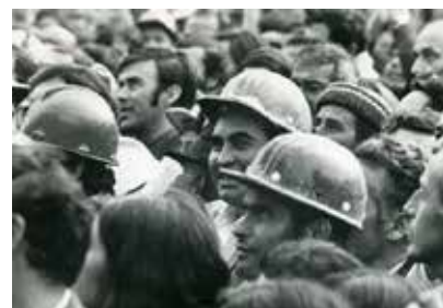
Documentaire (1976) de Patricio Guzmán

Six longues années, cinq heures d'images édifiantes, La Bataille du Chili retrace l'histoire du gouvernement de Salvador Allende, la marche vers le coup d'État, jusqu'à la dictature de Pinochet. Monument du cinéma militant et direct, cette passionnante trilogie n'est ni un film journalistique, ni un film d'archives. Pour son auteur, « c'est la preuve cinématographique, jour après jour, de l'agonie d'une expérience révolutionnaire qui touche le monde entier parce qu'elle se présente comme une expérience pacifique du passage au socialisme ».